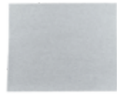
Brúsny papier 3M