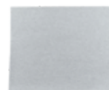
Brúsny papier 3M